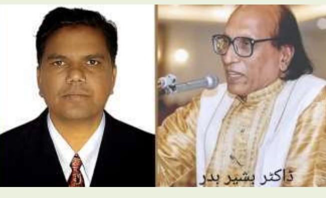
ڈاکٹر بشیر بدر

از قلم: ڈاکٹر محمد ناصر باغبان بیڑ: ڈاکٹر محمد ناصر باغبان، اسسٹنٹ پروفیسر شعبہ اردو ملیہ سینٹر کالج پیر لکھنے ہیں اردو ادب کا ایک اور عظیم خسارہ پچھلے شاہ حسین نہری، فاروق سید اور اب ڈاکٹر بشیر بدر اردو کا درخشاں ستارہ جو نظموں میں زندگی، محبت اور انسانیت کی خوشبو بھرتا رہا، آج خاموش ہو گیا۔ ڈاکٹر بشیر بدر صاحب کا انتقال شاعری کے ایک عہد کا خاتمہ اور ہمارے لیے ایک ناقابل تلافی نقصان ہے۔ ان کے لیے اقبال کا یہ شعر یاد آتا ہے۔ "ہزاروں سال ترس گئی اپنی بے پوری یہ روتی ہے" "بڑی مشکل سے ہوتا ہے جن میں دیدہ اور پیدا" بشیر بدر جدید اردو غزل کے سب سے مقبول اور بااثر شاعروں میں شمار ہوتے ہیں۔ ان کا اصل نام سید محمد بشیر تھا وہ ۱۵ فروری ۱۹۳۵ء کو بھارت کے اتر پردیش، ایو دھیا میں پیدا ہوئے۔ علی گڑھ مسلم یونیورسٹی سے اعلیٰ تعلیم حاصل کی۔ ان کی شاعری کی خاص بات سادہ زبان، گہرا احساس، محبت، جدائی اور انسانی رشتوں کی نزاکت ہے۔ بشیر بدر جدید اردو غزل کے ان عظیم شاعروں میں شمار ہوتے ہیں جنہوں نے سادہ زبان، گہرے احساسات اور دل کو چھو لینے والے انداز سے اردو شاعری کو نئی پہچان دی۔ یہی وجہ ہے کہ ان کے اشعار خواص کے ساتھ عوام میں بھی حد مقبول ہوئے۔ ڈاکٹر بشیر بدر کی سب سے بڑی خوبی یہ تھی کہ انہوں نے مشکل الفاظ کی بجائے روزمرہ کی زبان میں ایسی غزلیں کہیں جو ہر دل تک پہنچ سکیں۔