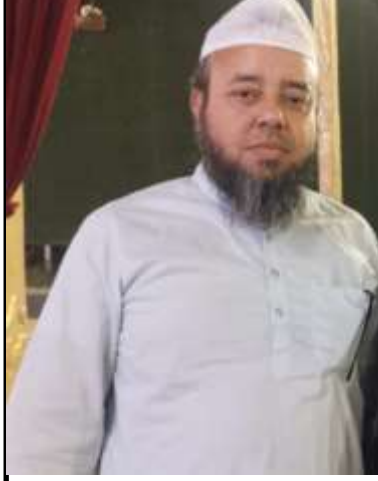
مصنوعی ذہانت، ایسی طاقت، سوشل میڈیا اور جدید ذرائع ابلاغ انسانیت کے لیے عظیم نعت بن سکتے ہیں، لیکن اگر ان کی رہنمائی حکمت اور اخلاق نہ کریں تو یہی طاقتیں بڑے مسائل پیدا کر سکتی ہیں۔

علم کی قیادت میں طاقت کا استعمال انسانی زندگی میں دو تہیں ہمیشہ سے بنیادی اہمیت رکھتی ہیں: شاستر اور شستر۔ شاستر سے مراد علم، حکمت، اخلاق، تربیت اور بصیرت ہے، جبکہ شستر سے مراد طاقت، قوت، اختیار اور عمل کی صلاحیت ہے۔ سوال یہ نہیں کہ ان دونوں میں کون زیادہ اہم ہے، بلکہ اصل سوال یہ ہے کہ ان دونوں کا باہمی تعلق کیا ہونا چاہیے۔ تاریخ، فلسفہ، مذہب اور انسانی تجربہ سب ایک ہی جواب دیتے ہیں: پہلے شاستر، پھر شستر۔ علم کے بغیر طاقت ایسی تلوار ہے جسے چلانے والا یہ نہیں جانتا کہ اسے کس مقصد کے لیے استعمال کرنا ہے۔ ایک طاقتور شخص اگر شعور اور اخلاق سے محروم ہو تو اس کی طاقت دوسروں کے لیے خطرہ بن سکتی ہے۔