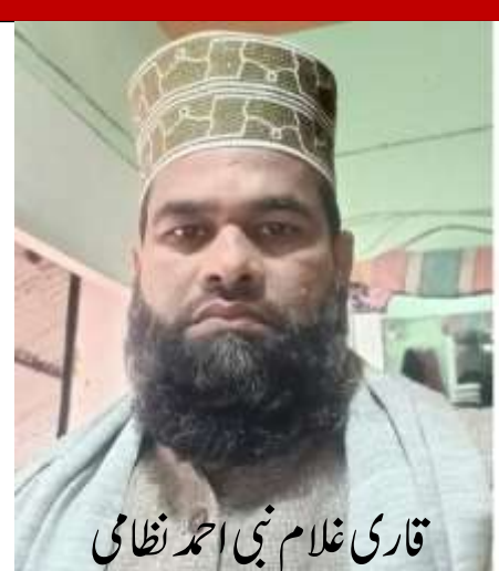
قاری غلام نبی احمد نظامی

دیگوں تک محدود نہیں تھا بلکہ وہ انسانیت کی خدمت، اخوت کی ترویج اور محبت کے فروغ کا ایک مستقل مرکز تھا۔ وہاں روٹی کے ساتھ احترام ملتا تھا، سانس کے ساتھ خلوص ملتا تھا اور پانی کے ساتھ دعائوں کی ٹھنڈک بھی نصیب ہوتی تھی۔ آج جب دنیا میں خود غرضی، مادہ پرستی اور انفرادیت کے رجحانات بڑھ رہے ہیں، مخدوم اکل حضرت سید قیام الدین شاہ بھیکا کی رحمتہ اللہ علیہ کے لنگر کا پیغام پہلے سے زیادہ اہم ہو گیا ہے۔ یہ پیغام ہمیں یاد دلاتا ہے کہ انسانیت کی اصل خدمت دوسروں کے دکھ درد میں شریک ہونے اور اللہ کی عطا کردہ نعمتوں کو اس کے بندوں تک پہنچانے میں ہے۔