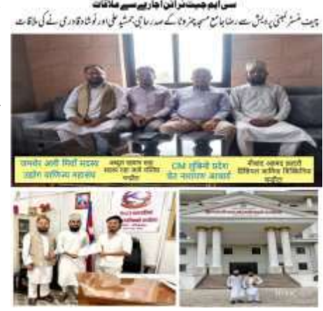
وزیر اعلیٰ لمبینی پردیش اور میسر شیبوراج نگر پالیکا کے درمیان ملاقات